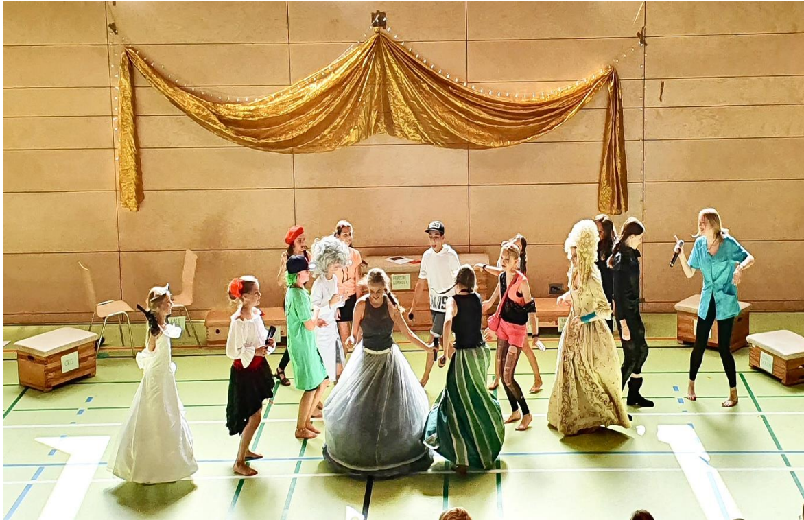
Eine wunderbare Woche!